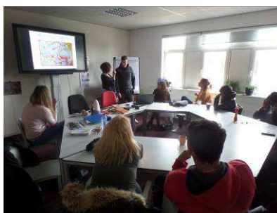
Mind at Work Almere