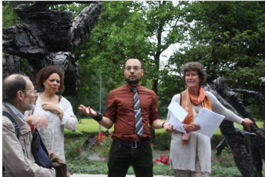
Thema "working through trauma"

Studenten van de universiteit van Hamburg i.s.m. de VU bespraken het thema "working through trauma" ondermeer bij het Nationaal slavernijmonument in het Oosterpark.