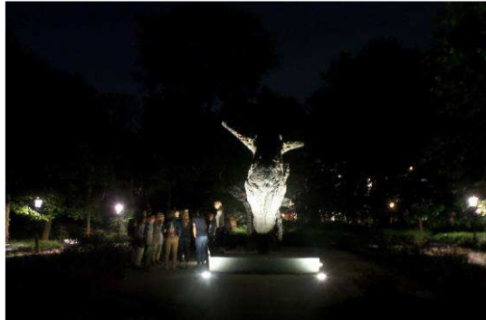
Slavernijmonument bij avondlicht