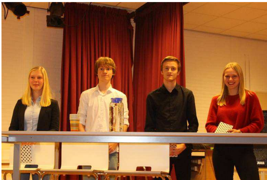
Winnaars van het schooldebat op het Damstede Lyceum