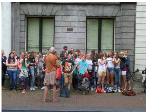
Erfgoedwandeling - Markland College Oudenbosch