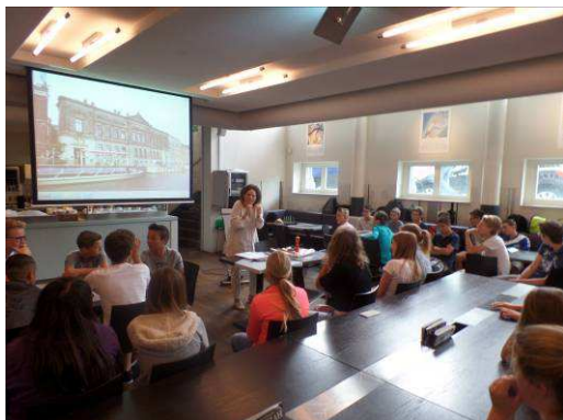
Out of the box - Markland College Oudenbosch